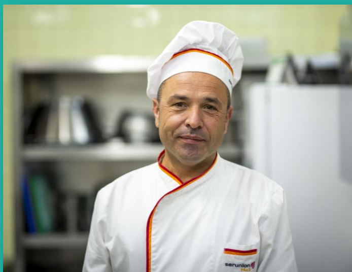
Adrián Colegio Trinitarias (Valencia)